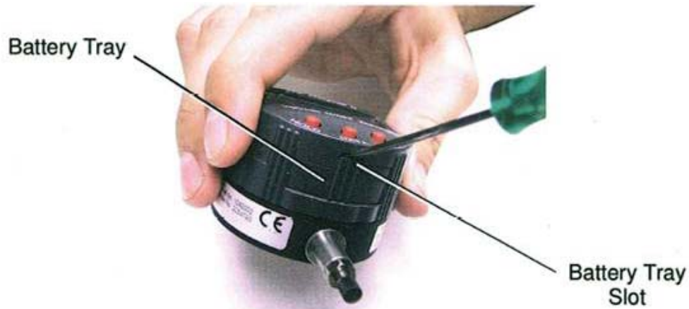
Abbildung 4: Öffnen des Batteriefachs