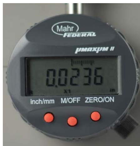
Abbildung 2: Bedien- und Anzeigefeld

Die Anordnung der Bedientasten und die Darstellung der Anzeigefunktionen entnehmen Sie bitte der Abbildung 2.