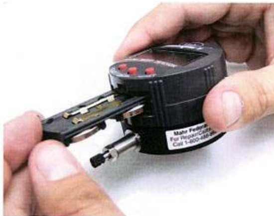
Abbildung 5: Herausziehen des Batterieeinschubs