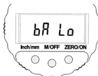
Abbildung 3: Batteriewechselanzeige