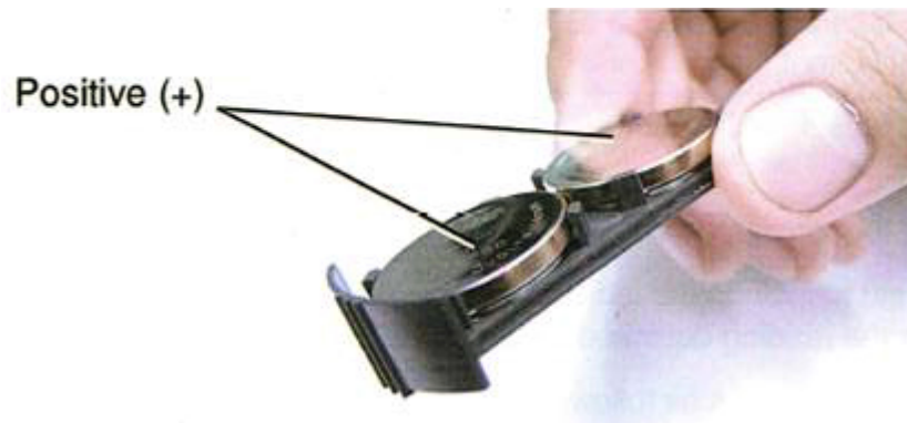
Abbildung 6: Wechseln der Batterien