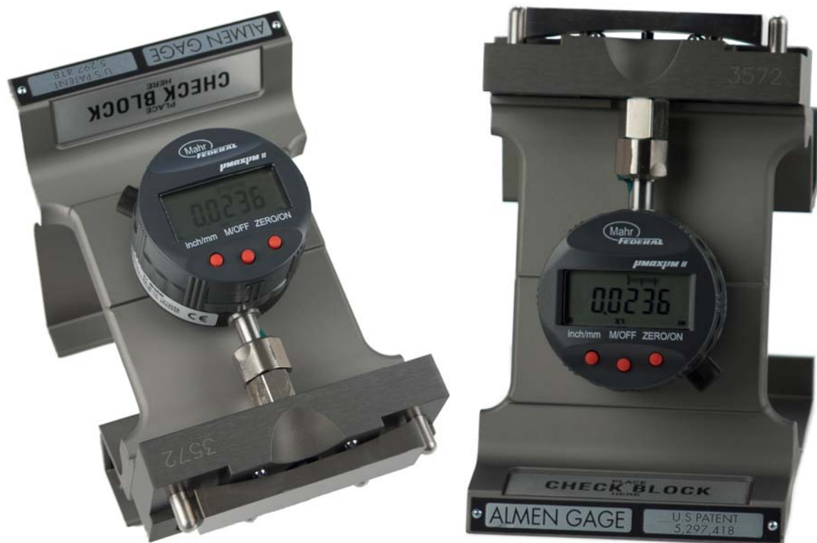
Abbildung 1: Almen-Messgerät TSP-3

Die drehbare Anzeige erleichtert die Ablesung unter verschiedenen Einsatzbedingungen, siehe Abbildung 1.